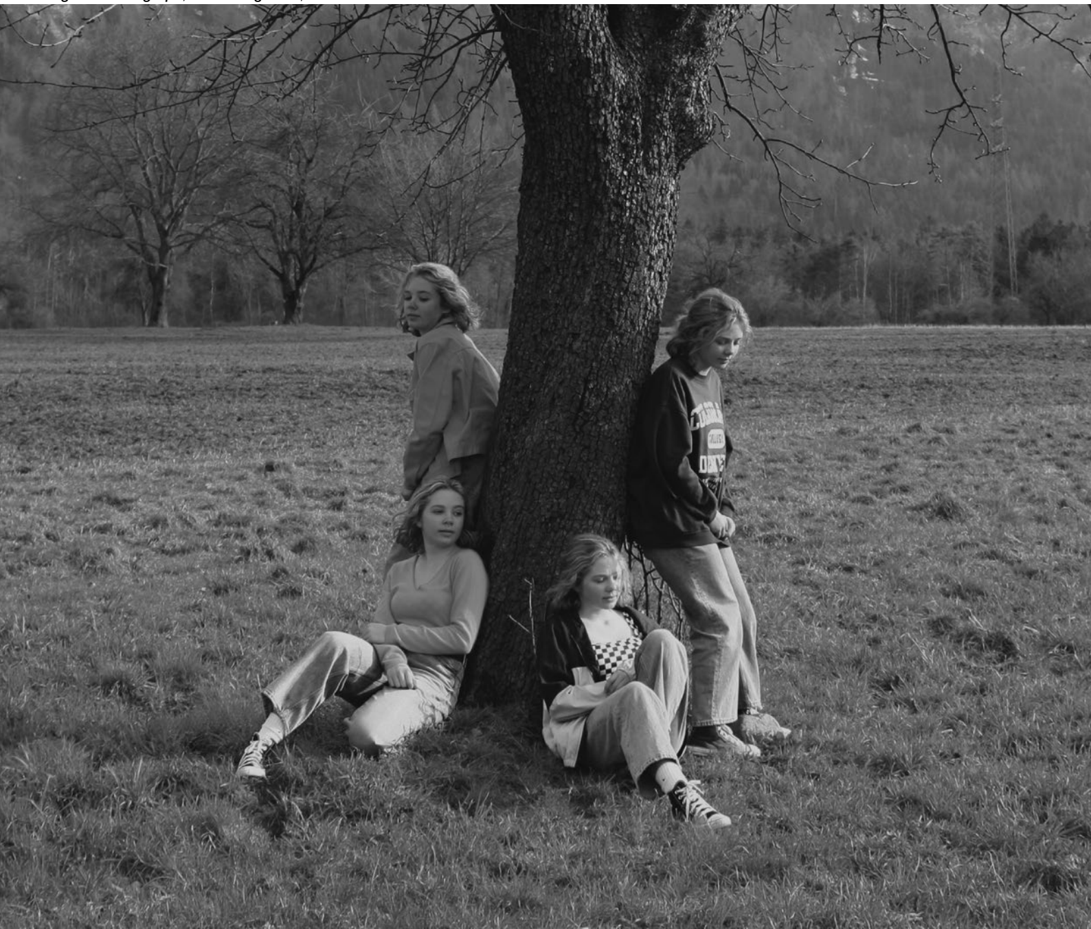
Fotografie Photograph, Grace Ongarello, Fachklasse Grafik 2021