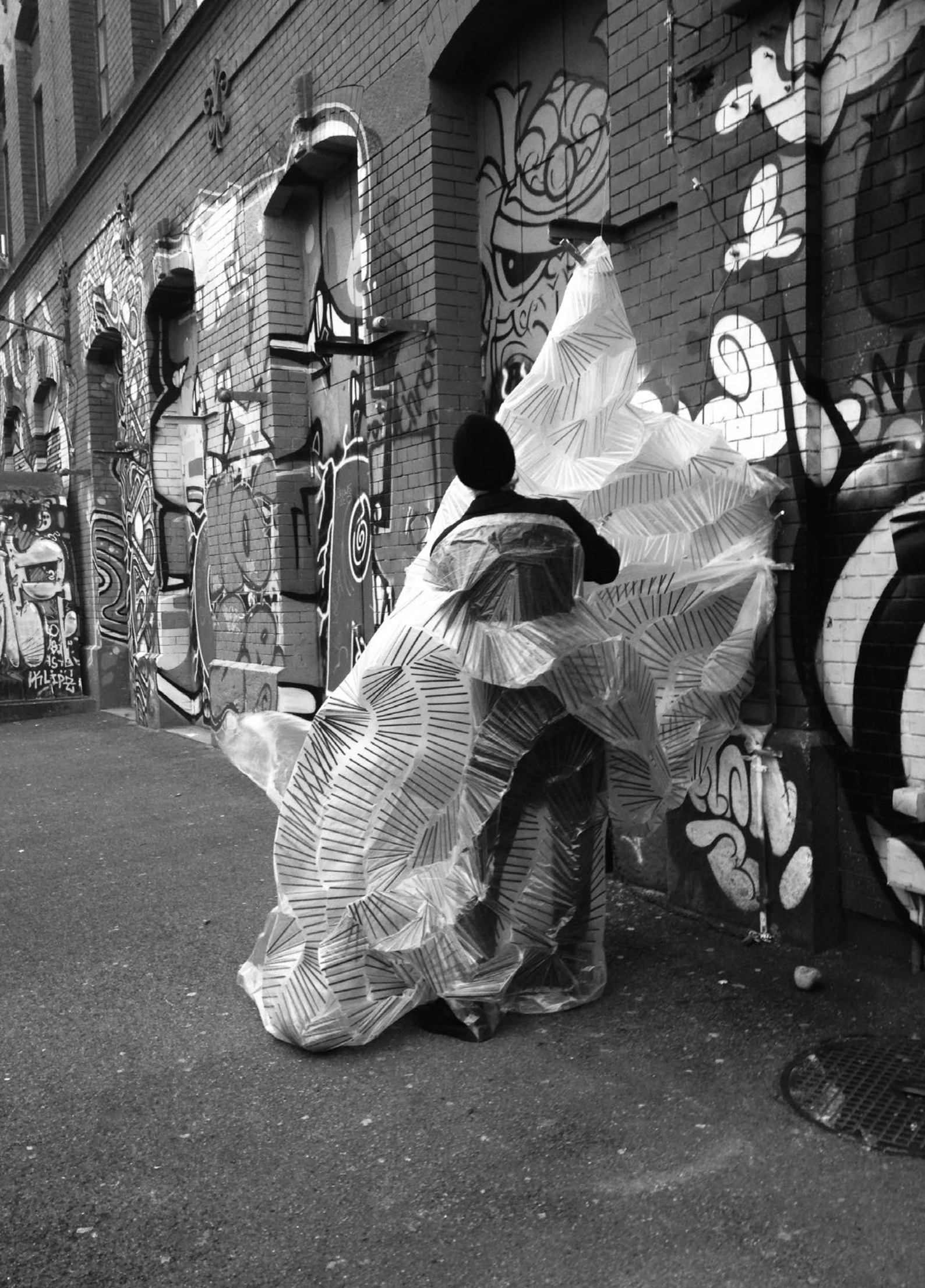
Skulpturen in Bewegung bei Martina Vontobel, Weiterbildung, 2019