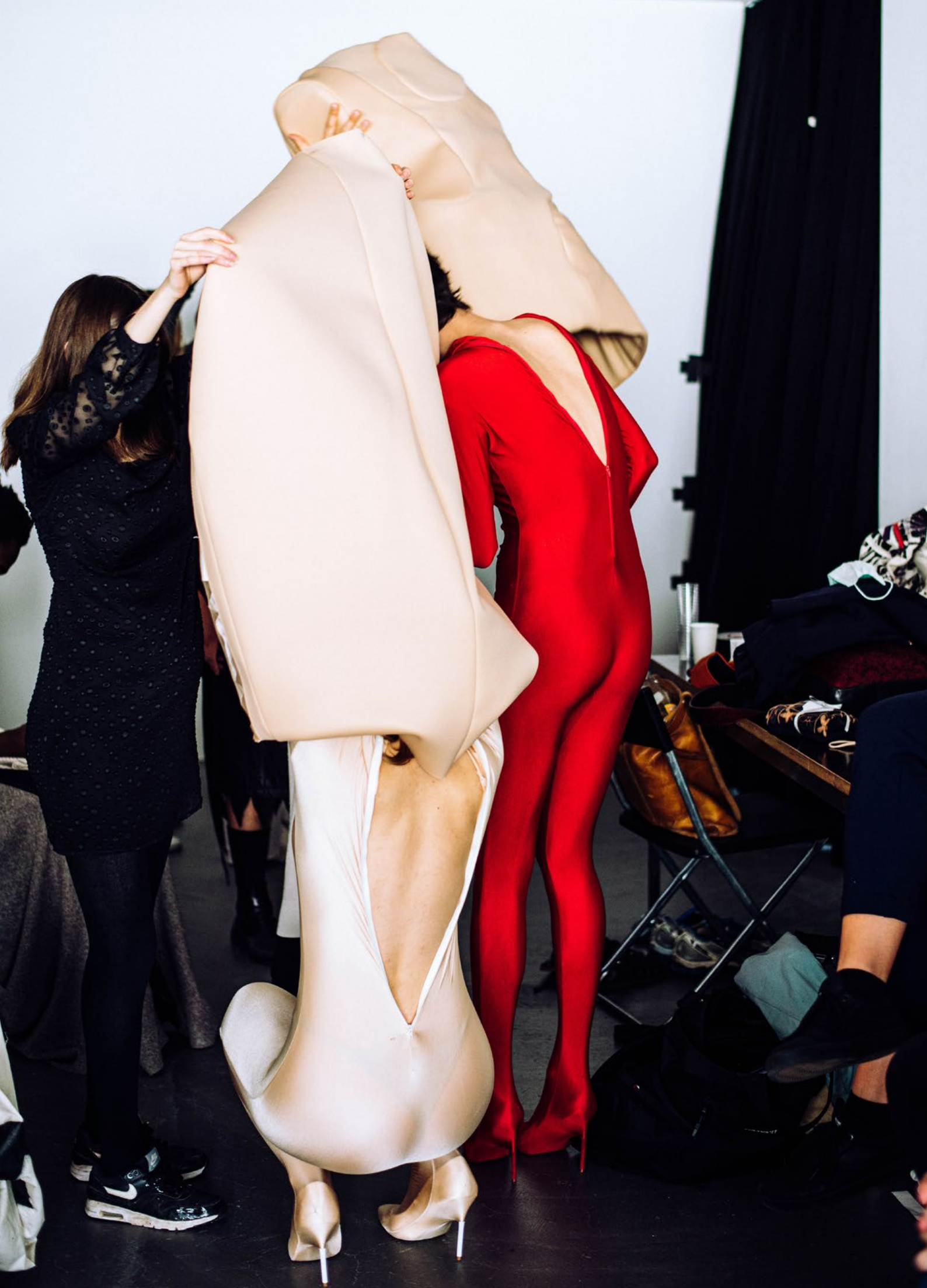
Backstage Diplom-Schau 2021