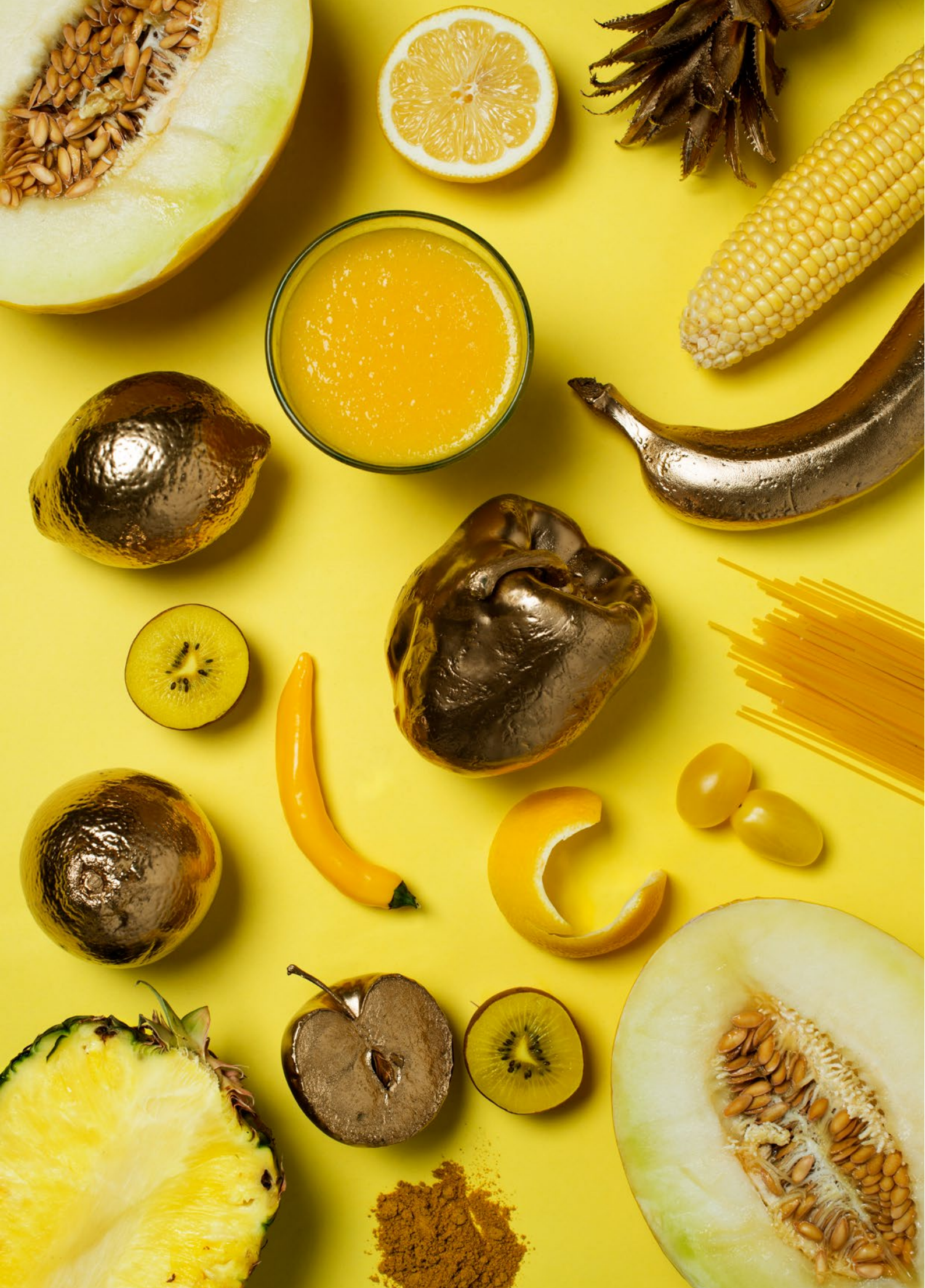
Gelb & Gold, Lidija Vuckovic, Studiengang Fotografie 2020