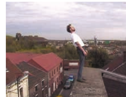
Don't try , de Claude Cattelain, © Claude Cattelain

Ce programme réfléchit le stand-up dans sa forme pure, pour prolonger la fascination que l'on éprouve face à cette pratique où un homme se donne en spectacle devant un public prêt à le détruire en moins d'une minute. Il se saisit également, en l'inversant, de l'affirmation si courante qui fait du stand-upper un performeur. Les films présentés investissent ainsi des postures similaires à celles du stand up : un homme seul, debout, qui tente de captiver un public, ou qui, immobile, s'approche peu à peu d'une chute.