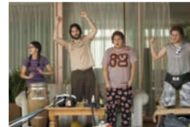
En cloque, mode d'emploi, de Judd Apatow, © Universal

États-Unis, 2007, 129', coul., vostf avec Seth Rogen, Katherine Heigl, Paul Rudd