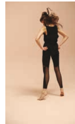
Image tirée de la performance Lord of Beef (2014), par Michael Underwood, © Ieva Misevičiūtė

Issue du monde du cirque, l'artiste associe depuis ses débuts langage du corps et humour, danse et discours, « punchline » et chute. Dans la performance Lord of the Beef , Ieva Misevičiūtė s'aventure, vers un jeu de mimes, quasiment primitif, qui repose sur les bases du théâtre et de la comédie. Elle dépeint ici des objets, des gens, des phénomènes, et des concepts philosophiques. Jusqu'à un irrésistible final, s'appuyant sur le lexique de la technique du Butô, où le corps du performer s'abandonne peu à peu au mouvement sur lui-même, où le jeu théâtral rejoint le rituel.