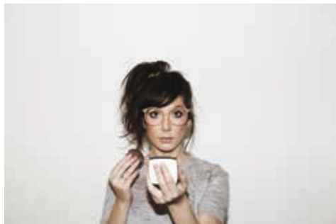
Nora Hamzawi

Sur réservation à lescinemas@centrepompidou.fr