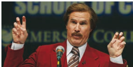
Légendes vivantes, d'Adam McKay, © Paramount

Une star du stand-up à laquelle un débutant demandait un conseil aurait répondu : « Adressez-vous au public ». Ce lien direct avec les spectateurs considérés comme autant de proches à qui l'on confie les détails intimes d'une vie si ratée qu'elle fait rire est le pilier du stand-up. Un pilier bien plus solide que le fameux mur de briques sur lequel s'appuient les comedians .