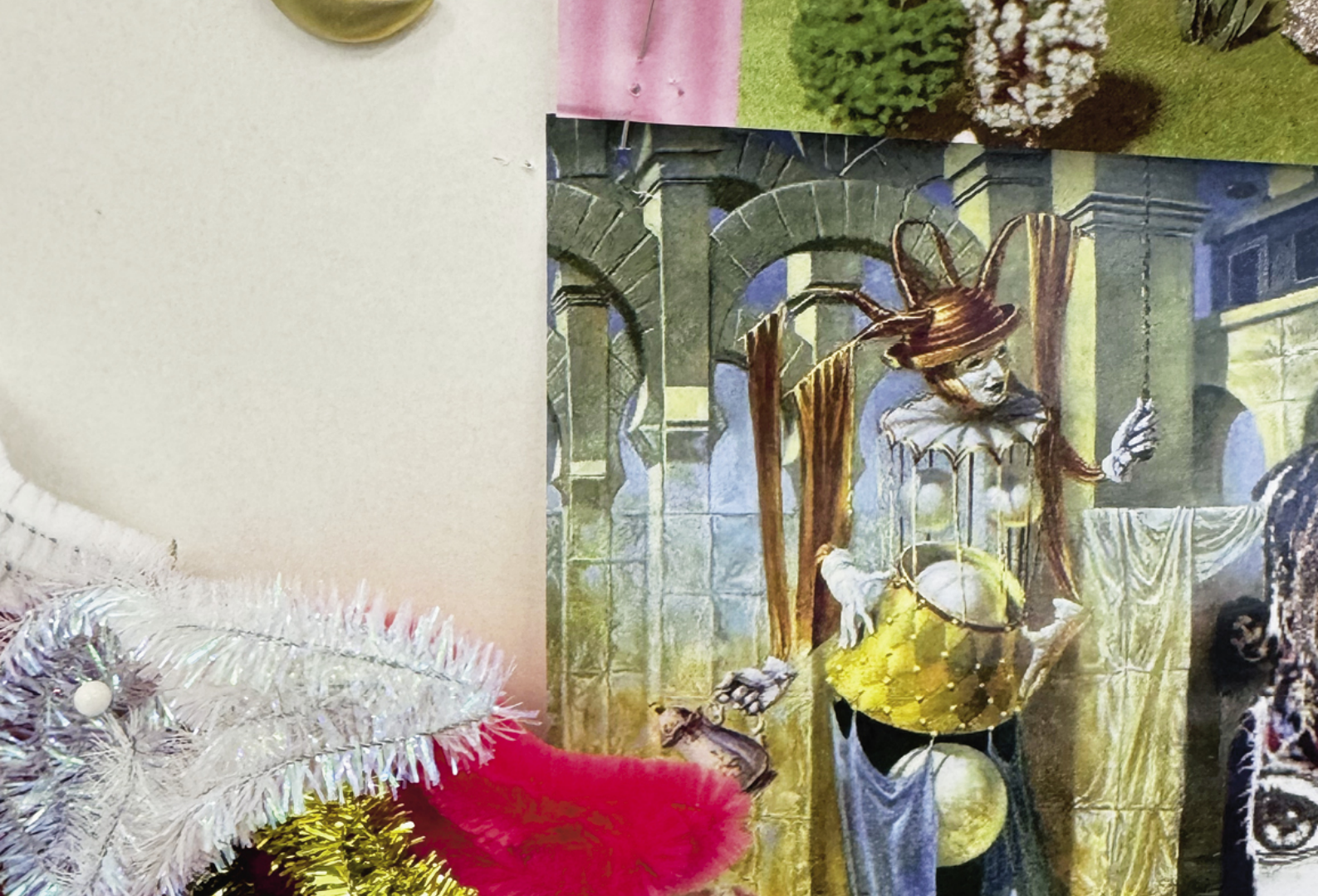
Diese Seite oben: Abschlusspräsentation im Projekt Kollektionsgedanke der Kollektion von Mario Dinis Matias Montinhos im Studiengang Modedesign HF, 2026, Foto: Véronique Hoegger Diese Seite unten: Ausschnitt aus der Zwischenkritik der Diplomarbeit von Annika Javet aus dem Studiengang Mode HF, 2026, Foto: Nicole Schmidt Rückseite: Unterrichtsimpersion aus dem Studiengang Modedesign HF, 2026, Foto: Véronique Hoegger