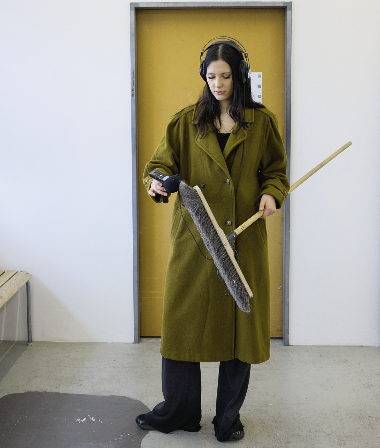
Vorderseite und diese Seite: Unterrichtsimpressionen aus dem Pooling, 2026, Fotos: Véronique Hoegger