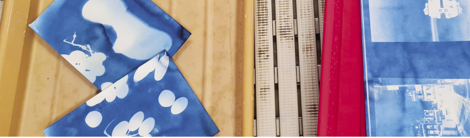
Vorderseite: Reportage Winteratelier Expressive abstract painting , 2026, Foto: Véronique Hoegger Diese Seite oben: Unterrichtsimpersion im Weiterbildungskurs Die Cyanotypie – eine magische Technik! , 2025, Foto: Gökçe Ergör Diese Seite unten: Unterrichtssituation im Winteratelier Expressive abstract painting , 2026, Foto: Véronique Hoegger