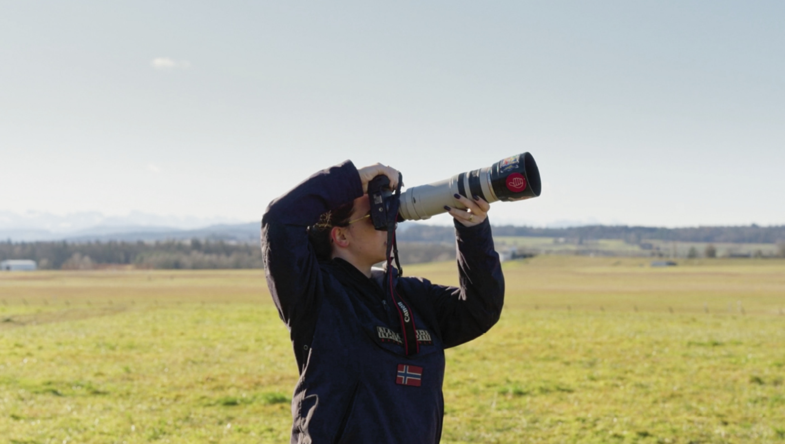
Vorderseite: Reportage aus Studiengang Film HF, 2026, Foto: Véronique Hoegger Diese Seite oben: Filmstill Über Uns von Noah Hinder aus dem Studiengang Film HF, 2026 Diese Seite unten: Reportage aus dem Studiengang Film HF, 2026, Foto: Véronique Hoegger