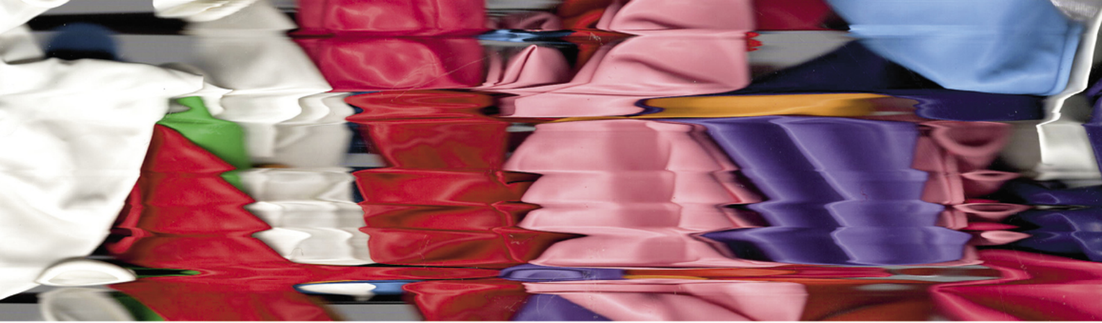
Vorderseite: Arbeit kaybolmak von Melda Karaali aus dem Projekt Shifting Realities des Studiengangs Fotografie HF, 2025 Diese Seite oben: Scan von Michael Schmid aus dem Projekt Shifting Realities des Studiengangs Fotografie HF, 2025 Diese Seite unten: Arbeit Nach dem Schweigen aus dem Projekt Shifting Realities von David Schelker, Studiengang Fotografie HF, 2025