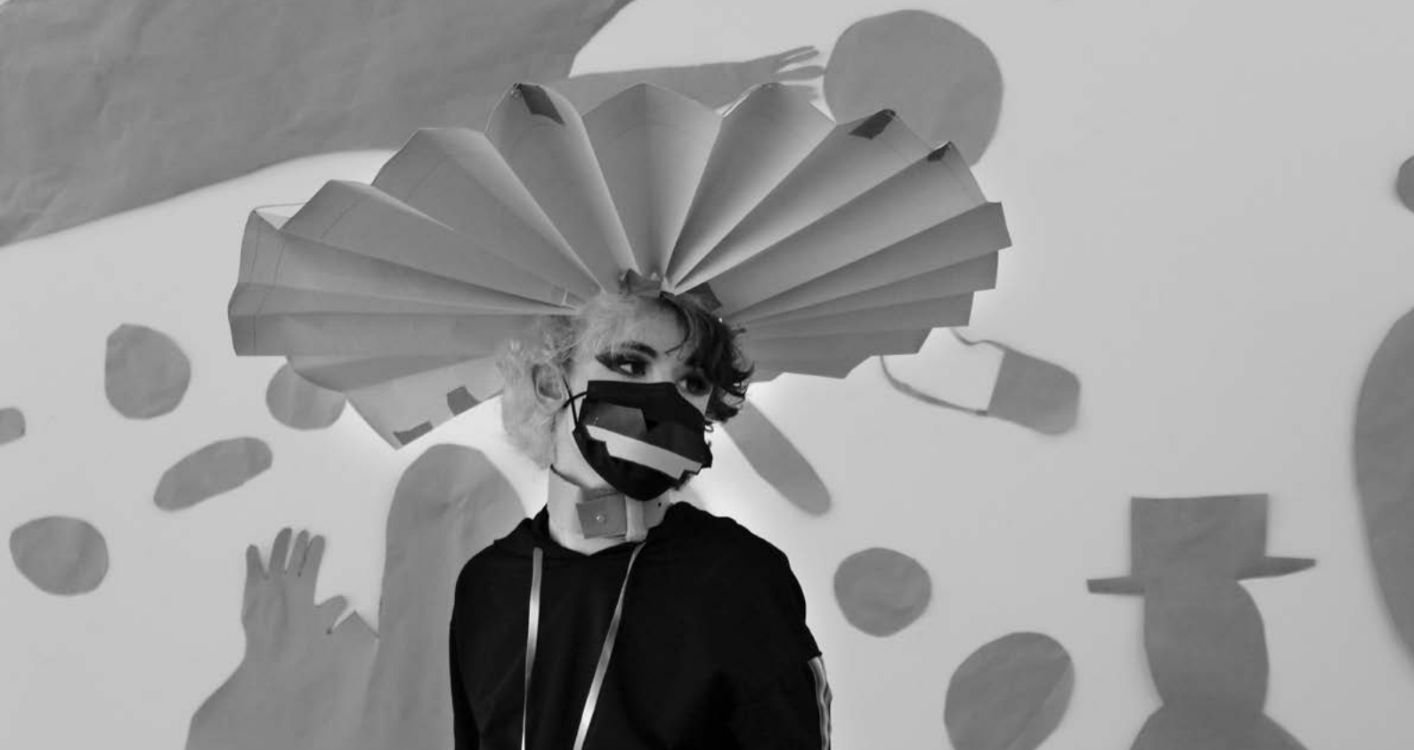
Diese Seite oben: Ferienkurs Sportferien Schnupperwoche Gestaltung , 2021, Foto: Kursteilnehmer:innen Diese Seite unten: Ferienkurs Sommer, Eine Bilder-geschichte zeichnen und drucken , 2021, Foto: Kristina Slavska Rückseite oben: Ferienkurs Herbst, Grafik entdecken , 2021, Foto: Marlon Ilg Rückseite unten: Ferienkurs Sommer, Schnupperwoche Gestaltung , 2021, Foto: Kristina Slavska